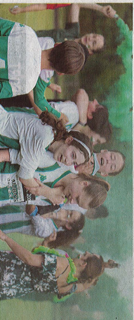
Les nombreux parents et supporters de l'ES Chargé ont célébré avec les fumigènes à la fin du match.