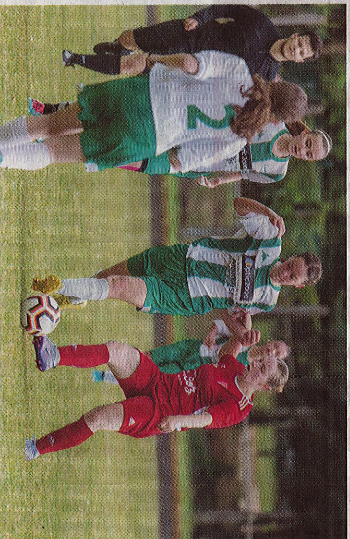
L'équipe U18 de l'ES Chargé, fondée récemment, a déjà connu la réussite.