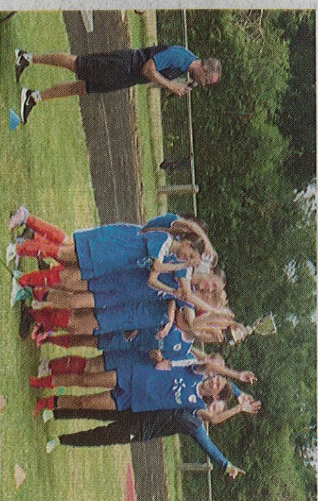
Les U15 de l'AF du Bourgneillois, victorieuses en finale.