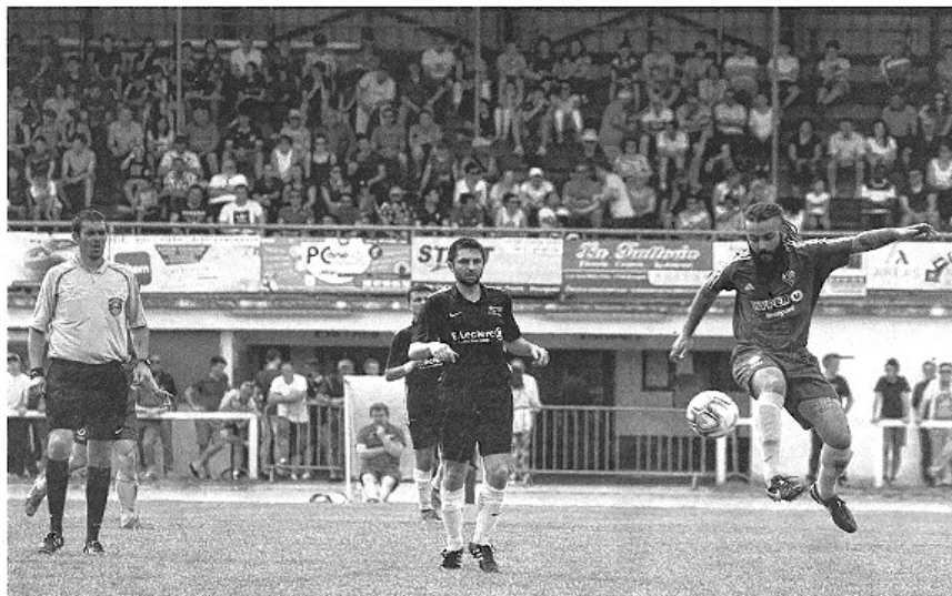
Devant leurs nombreux supporters, les Bourgueillois ont longtemps tenu tête aux Montlouisiens.