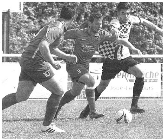
Les deux équipes, combattives, ont dû attendre la séance de tirs au but, favorable à Azay/Cheillé, pour se départager.