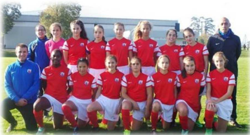
Sélection U15 F.