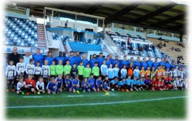
Plateau Départemental U9 Sélection Nationale Sapeurs-Pompiers