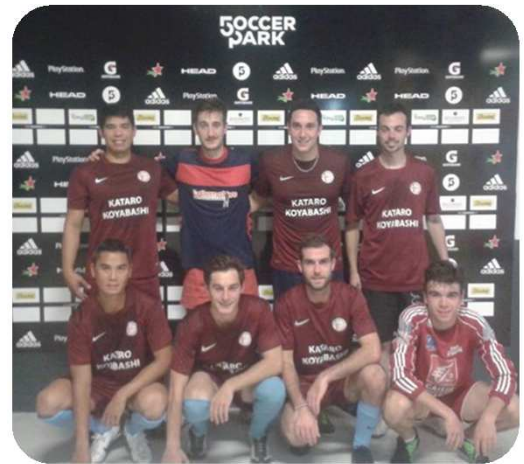
Soirée du Football Diversifié 2016 Au Soccer Park

La Rentrée du Foot a réuni en 2016 plus de 3000 enfants en Indre et Loire.