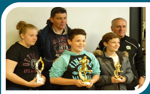
Les gagnants de l'édition 2015

Un grand merci à tous les clubs qui ont répondu favorablement à cette action menée par les commissions du district de recrutement (CDDRF) et des arbitres (CDA). Ils ont compris que l'apprentissage des règles du jeu fait partie intégrante du parcours des jeunes.