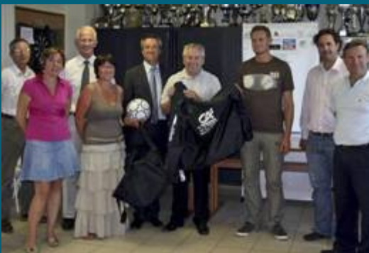
Remise label Au club de l'AS Chanceaux