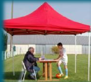
Un des ateliers