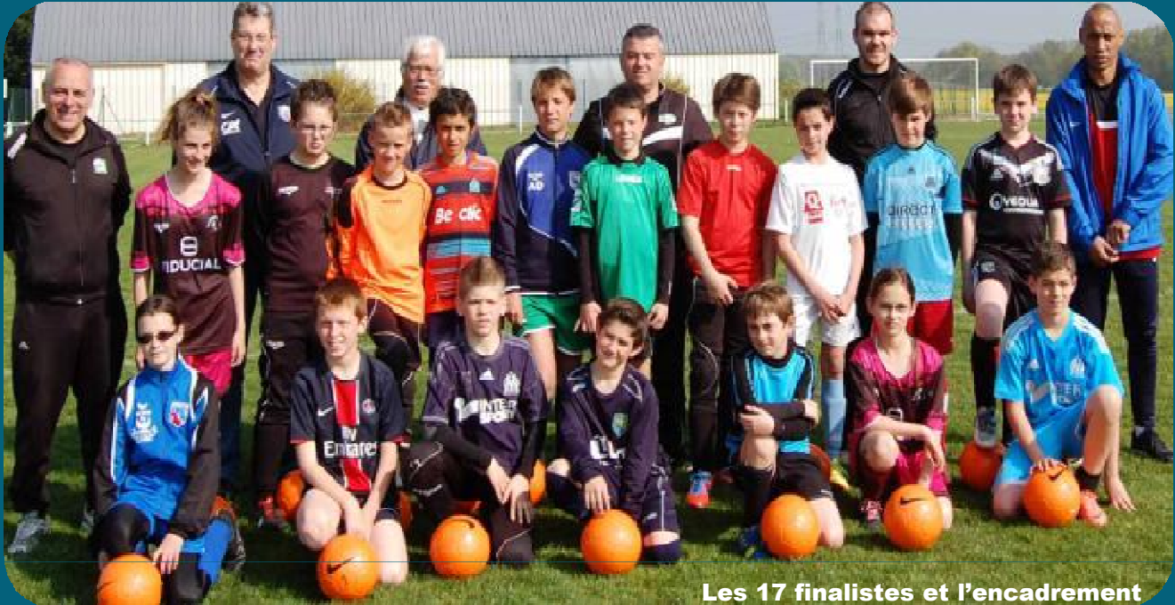
Les 17 finalistes et l'encadrement

Cette finale a rassemblé 17 jeunes U13 venus des quatre coins du département. Après une séance vidéo, six ateliers étaient proposés aux concurrents ; quatre techniques et deux sur les lois du jeu. Le but étant d'effectuer le parcours dans le temps le plus court avec les pénalités et les bonus récoltés dans chaque atelier.