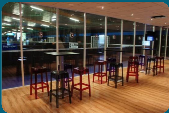
Bar de 120m 2 avec grand écran

http://www.youtube.com/watch?v=ua5tFmgKgiA&feature=c4-overview&list=UUoALDGtXOpObCNoQJND-6Vw