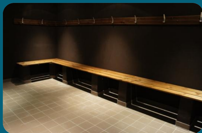
Douches collectives et individuelles