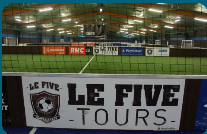
6 terrains synthétique dernière génération